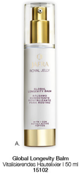
A. Global Longevity Balm Vitaliserendes Hautelixier | 50 ml 15102

Gelée Royale – altijd weer een weldaad: Het Royal Jelly Ritual van JAFRA biedt je huid een luxueuze allround verzorging voor grenzeloze schoonheid.