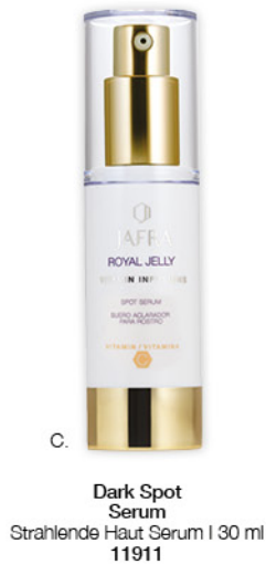
C. Dark Spot Serum Strahlende Haut Serum | 30 ml 11911