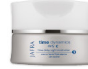
Time Delay Night Moisturizer Aktivierende Feuchtigkeitspflege für die Nacht 14412