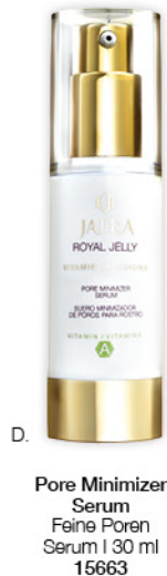
D. Pore Minimizer Serum Feine Poren Serum | 30 ml 15663