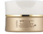
Gold Skin Boosting Moisturizer SPF 15 Boosting Feuchtigkeitspflege SPF 15 15168