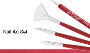
Nail Art Set

Met de vier Profi Nail-Art Tools van JAFRA creëer jij betoverende nagel designs,