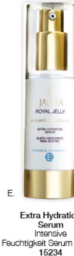
E. Extra Hydration Serum Intensive Feuchtigkeit Serum | 30 ml 15234