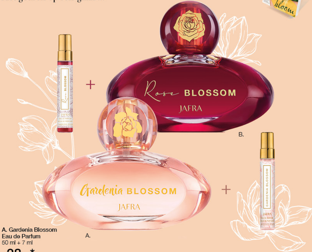
A. Gardenia Blossom Eau de Parfum 50 ml + 7 ml