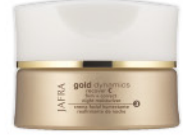
Gold Firm + Correct Night Moisturizer Straffende Feuchtigkeitspflege für die Nacht 14106