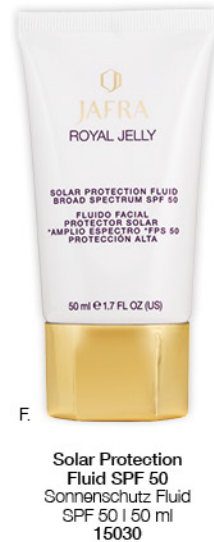
F. Solar Protection Fluid SPF 50 Sonnenschutz Fluid SPF 50 | 50 ml 15030