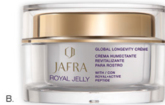
B. Global Longevity Crème Vitalisierende Hautpflegecreme | 50 ml 02921