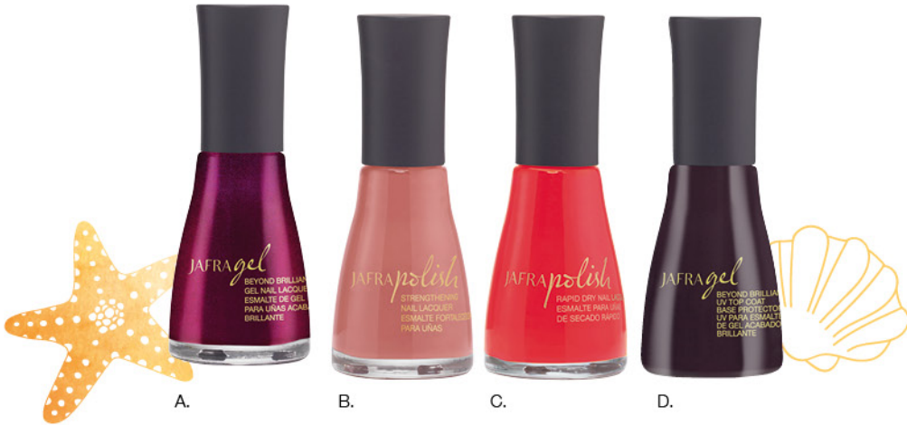
A. Beyond Brilliant Gel Nail Lacquer | Gel Nagellack 12 ml B. Strengthening Nail Lacquer | Kräftigender Nagellack 12 ml C. Rapid Dry Nail Lacquer | Schnelltrocknender Nagellack 12 ml D. Beyond Brilliant Gel UV Top Coat | Gel UV Überlack 12 ml

Sneldrogend, verzorgend of stralend – JAFRA biedt schitterende glans in klassieke en trendy zomerkleuren.