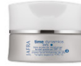
Time Protector Moisturizer SPF 15 Aktivierende Feuchtigkeitspflege SPF 15 15171