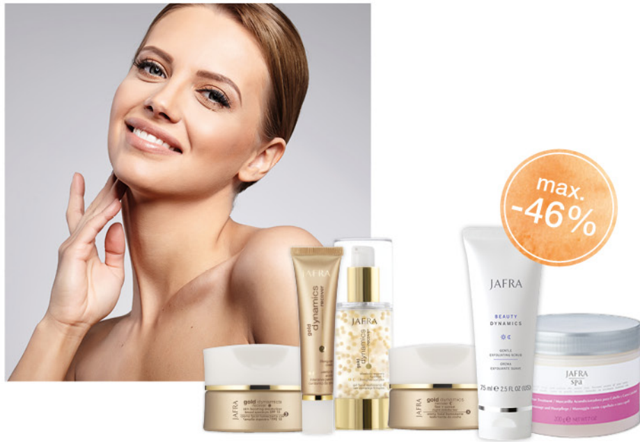
Abbildungen exemplarisch | Afbeeldingen zijn exemplarisch