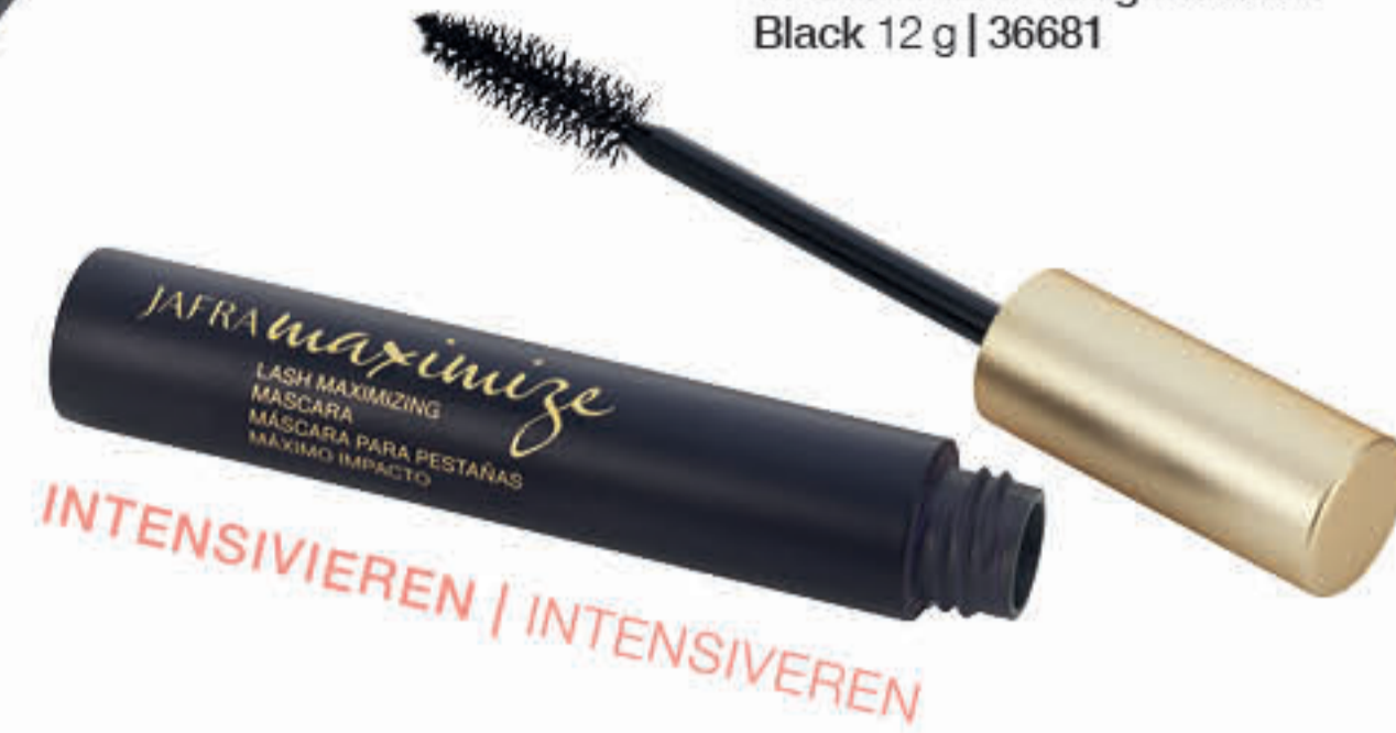
C. Lash Maximizing Mascara Black 12 g | 36681