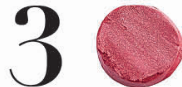
Blush Rose 14547

Voor een onmiddellijk frisse kleur ons Powder Blush- duo met het kwastje Pro Blush Brush aanbrengen en uitblenden.