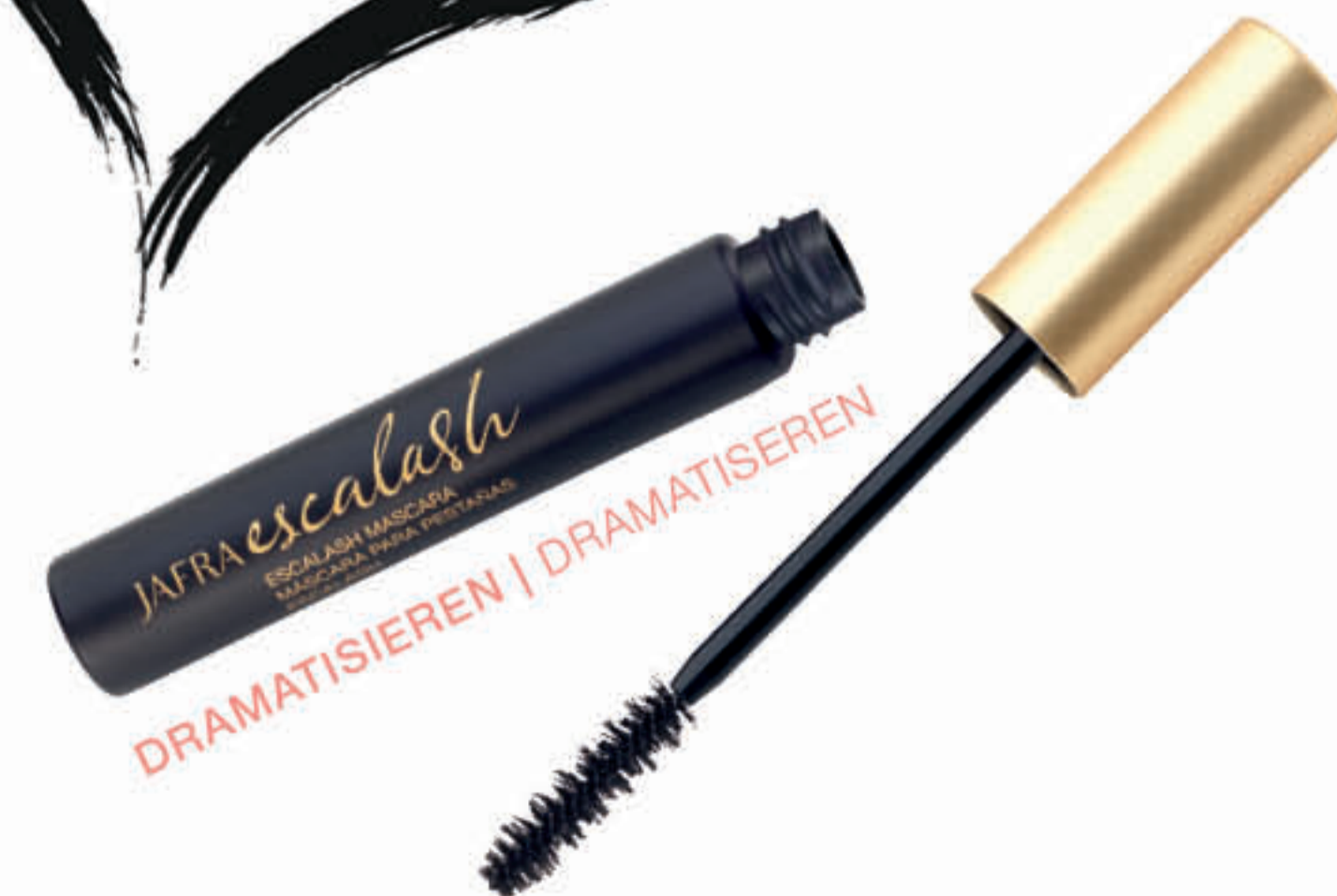
D. Weightless Volume Mascara Black | 36666