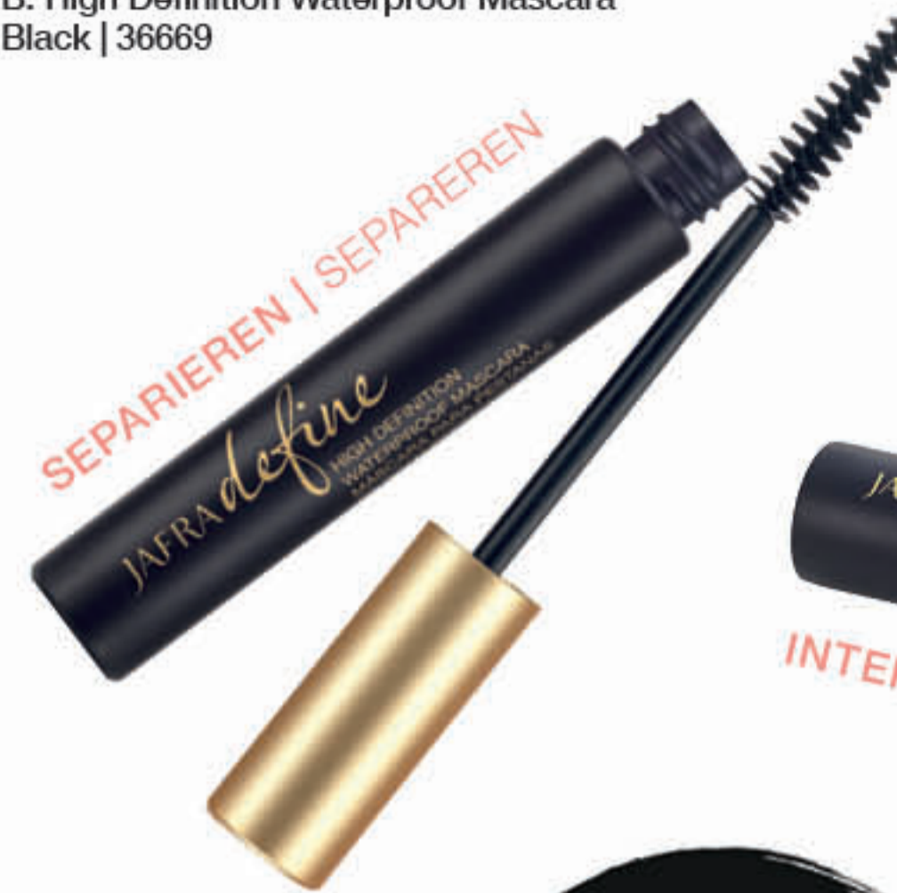
B. High Definition Waterproof Mascara Black | 36669