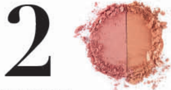
Rose Oro/ Duranzo 14571