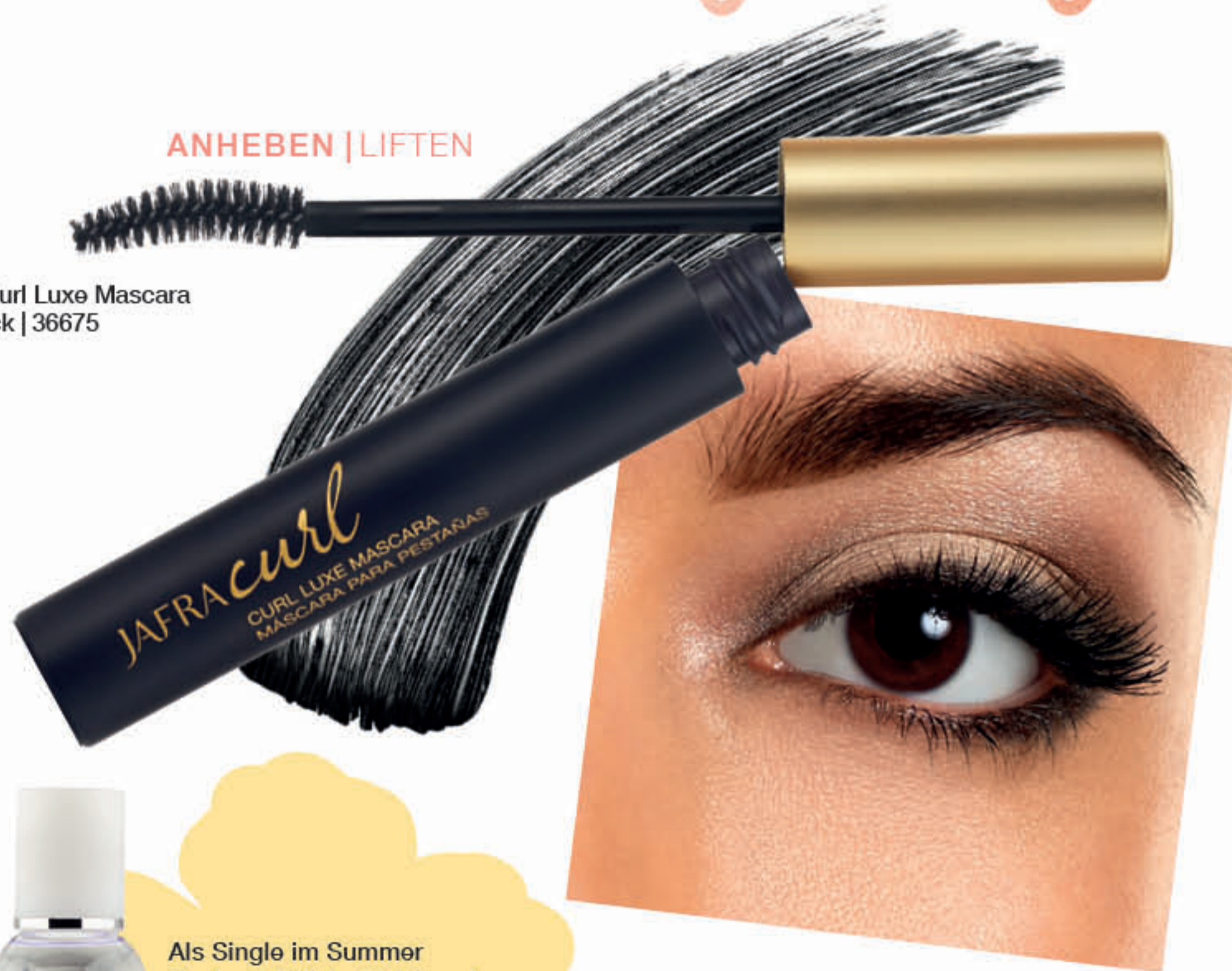
A. Curl Luxe Mascara Black | 36675