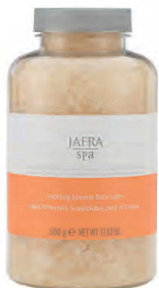
Soothing Mineral Bath Salts 84395