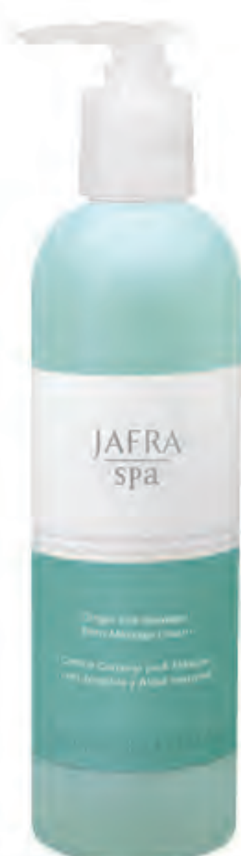
Ginger and Seaweed Body Massage Cream 27782