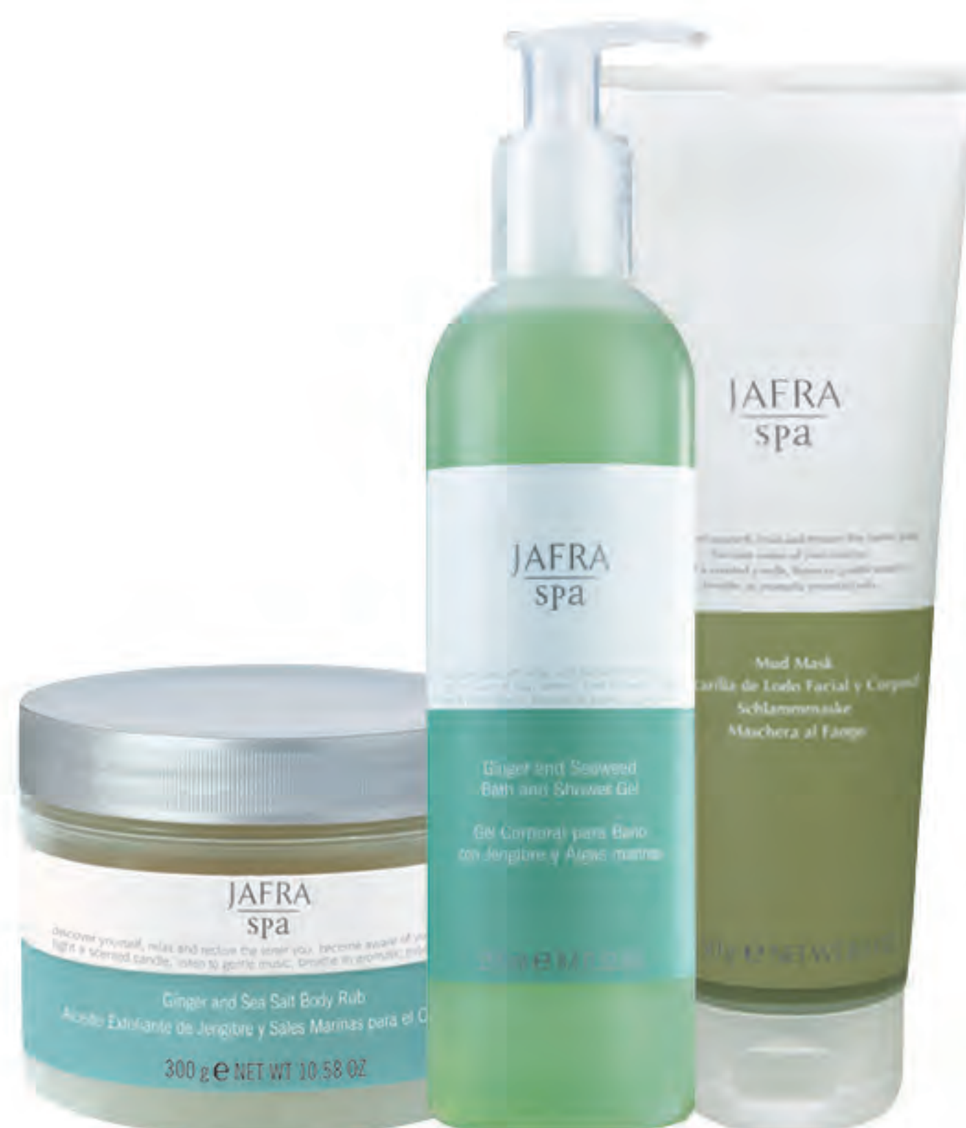
Abbildungen exemplarisch | Afbeeldingen zijn exemplarisch