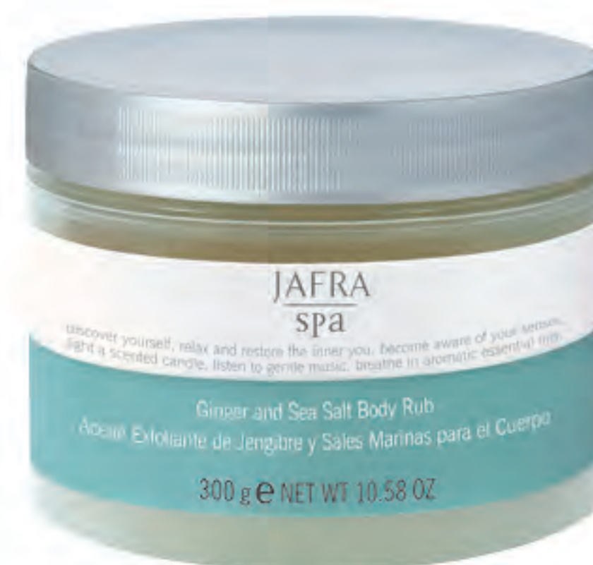
Ginger and Sea Salt Body Rub 84387