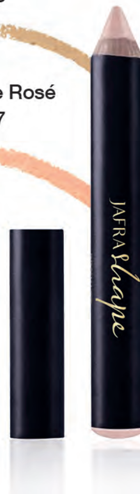
Matte Rosé 11317