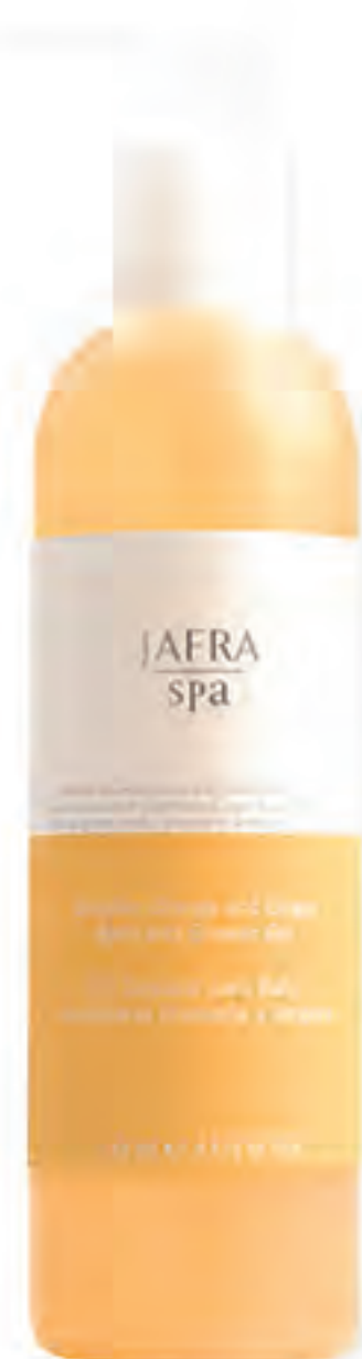
Brazilian Orange and Ginger Bath Shower Gel 20139