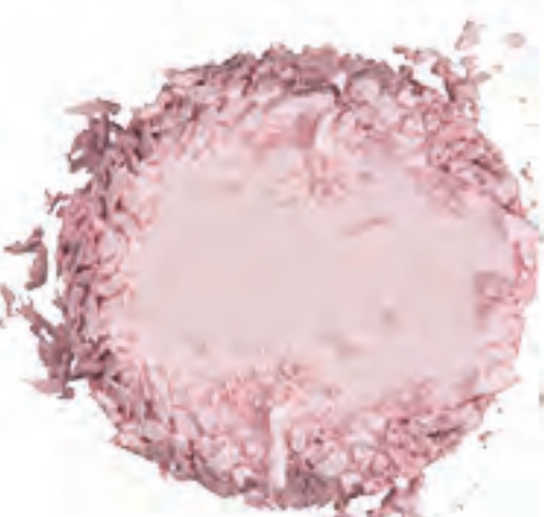
Pink Pearl 36939