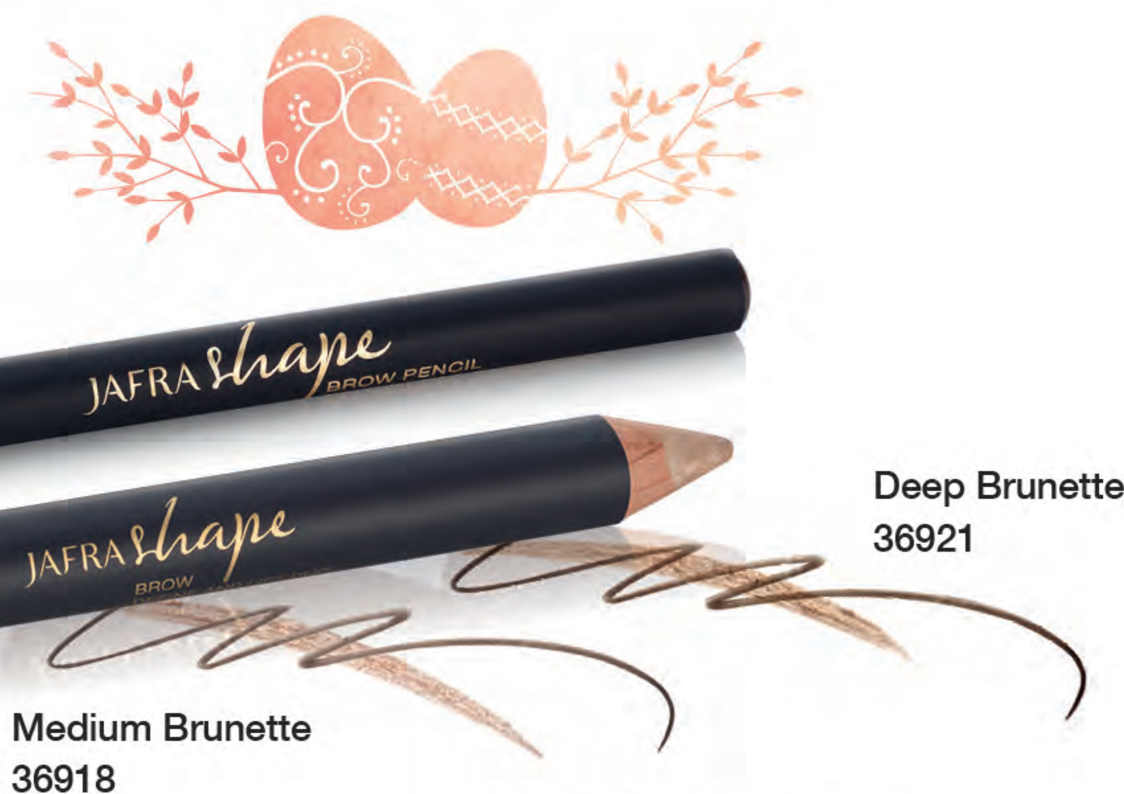
Medium Brunette 36918