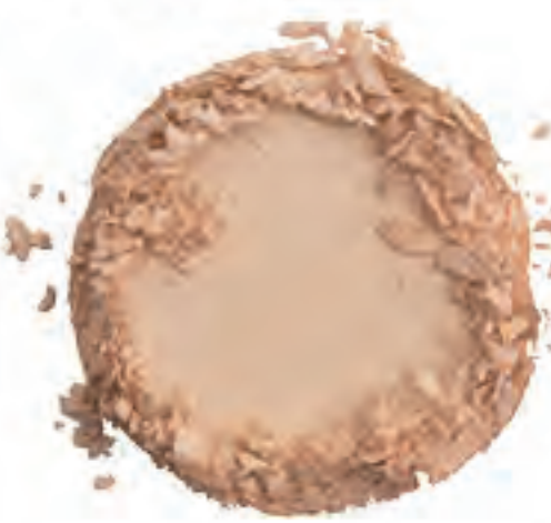
Beige Shimmer 36936