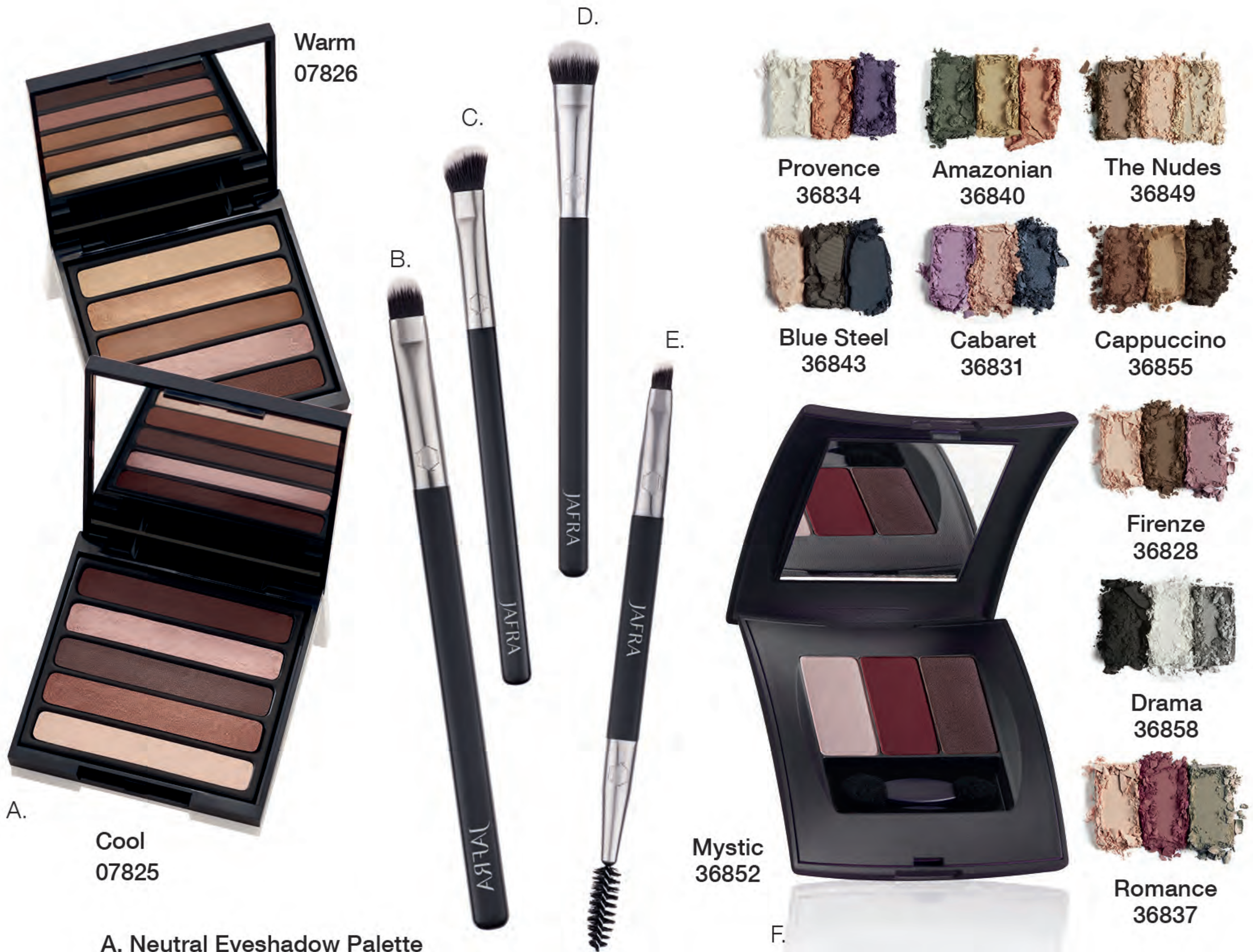
A. Neutral Eyeshadow Palette Neutrale Lidschattenpalette 6 g

Verleidelijke paascadeautjes voor je ogen