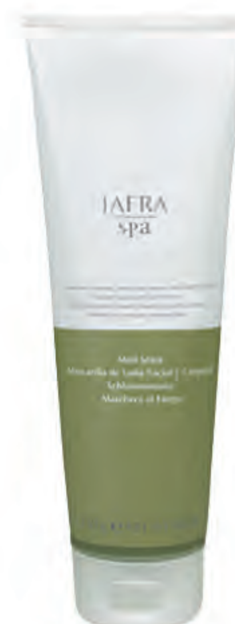
Mud Mask 21997