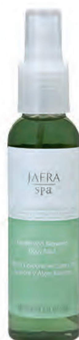
Ginger and Seaweed Body Mist 30244