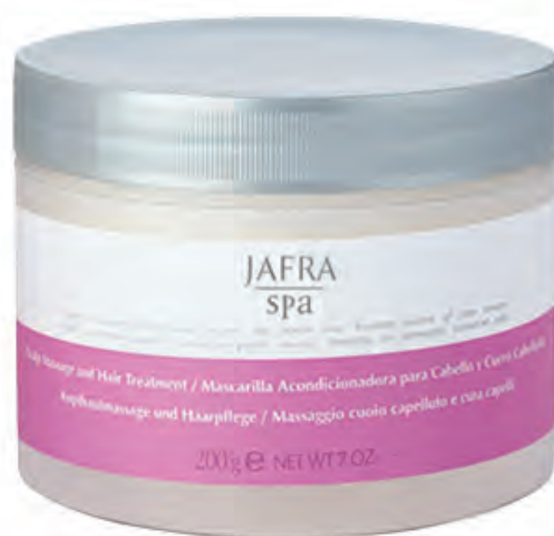
Scalp Massage & Hair Treatment 88987