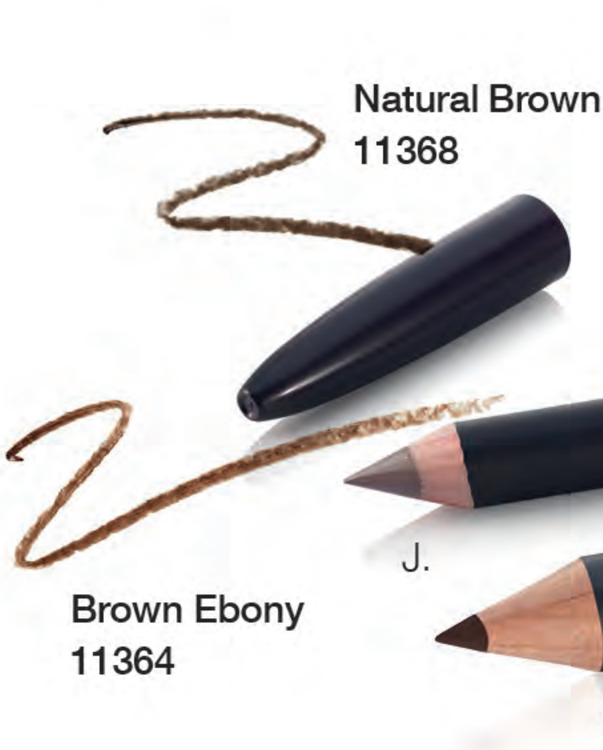
Natural Brown 11368