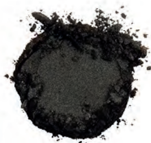
Black Diamond 36945