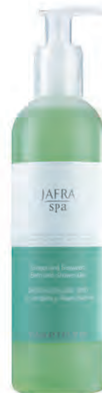
Ginger and Seaweed Bath and Shower Gel 27791