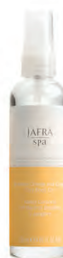
Brazilian Orange and Ginger Dry Body Oil 20136