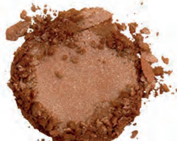
Bronze Luster 36942